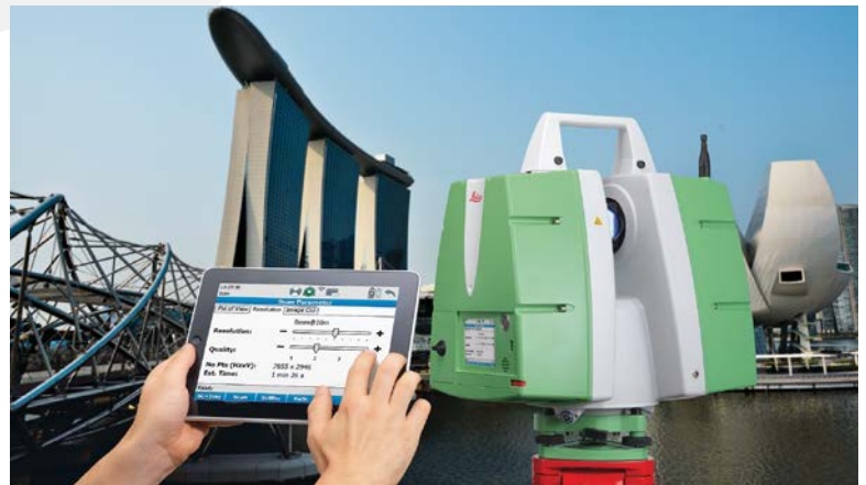
SCANNER 3D LEICA P20