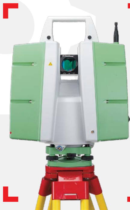
LASER SCANNER HDS 3D LEICA ScanStation P20

PRECISIONE DI 6MM A 100M RAGGIO DI AZIONE 120M VELOCITÀ DI SCANSIONE 1.000.000 PT/S