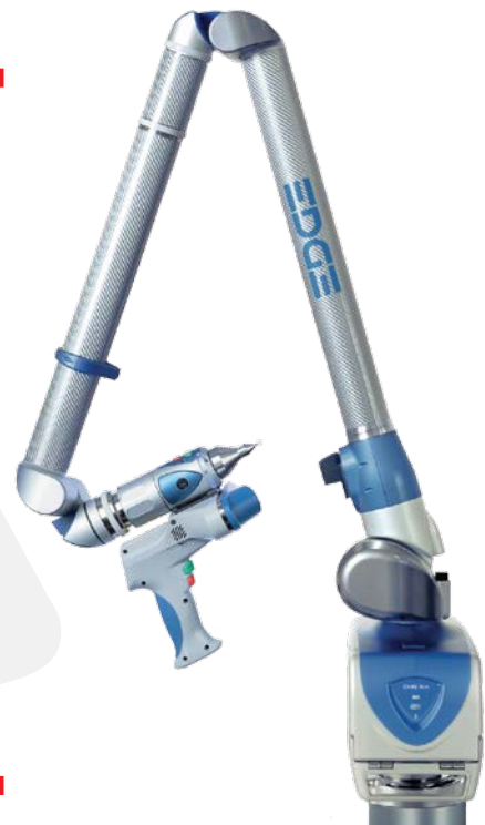
BRACCIO ANTROPOMORFO FARO SCAN2 Edge Scan Arm

PRECISIONE DI 6MM A 100M RAGGIO DI AZIONE 120M VELOCITÀ DI SCANSIONE 1.000.000 PT/S